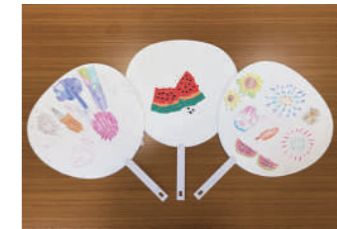
タイトル:うちわ 作者:鈴木順也、森江美佳、三浦泰輝 【チャレンジ・コヤリバ】