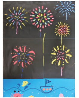
タイトル:夏の思い出 作者:虹班【サポートセンターまつば】