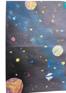
タイトル:七夕の夜 作者:清流園利用者【清流園】