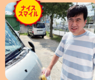
チャレンジ・コヤリバ