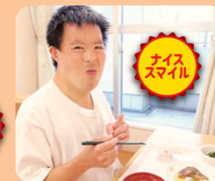
ショートステイぶちるば