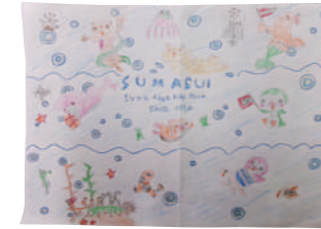
タイトル:おさかなルン ルン ルン 作者:七松分場利用者【塚口福成園】