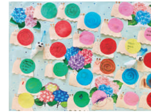
タイトル:梅雨の制作活動 作者:あいあい利用者【あいあい】