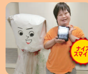
サポートセンターまつば