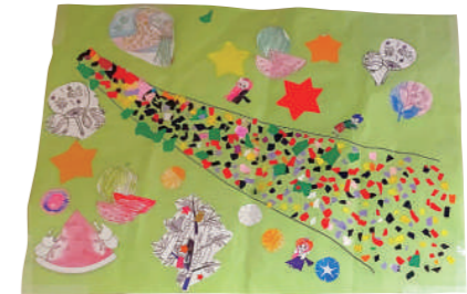
タイトル:七夕☆彗 作者:杭瀬利用者【杭瀬福成園】