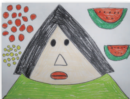
『Summer Staff』 河地 久佳子【あいあい】