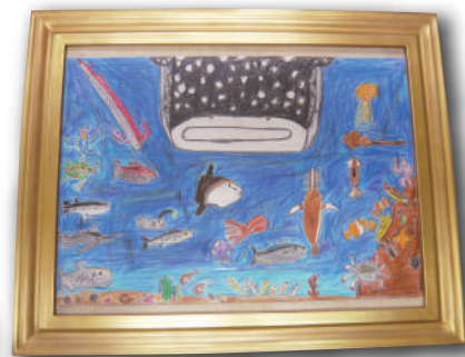
『水族館のさかなたち』 大久保 龍人【チャレンジ・コヤリバ】