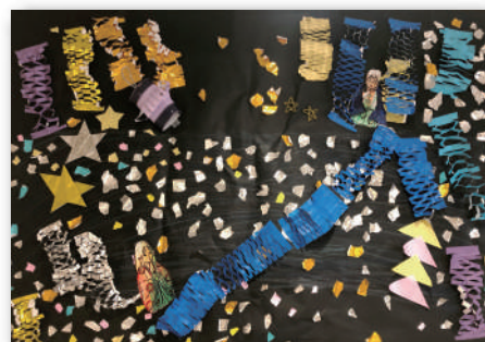
『星に願いを"たなばた"』 虹班【サポートセンターまつば】