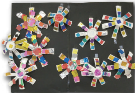
『紙コップDE花火』 分場【清流園】