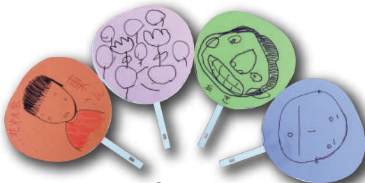
『うちわ』 南グループ【杭瀬福成園】