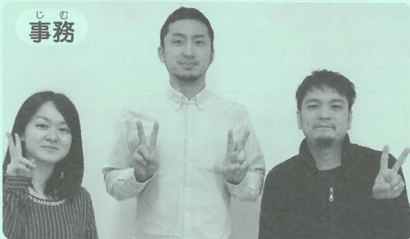
し む 事務