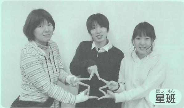
ほし はん 星班