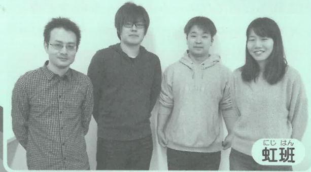
にし はん 虹班