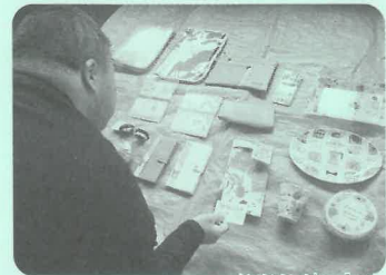
～フリーマーケットで買い物体験中の様子～

当日は、こまくさ会のみなさまだけでなく地域の皆さまも多く参加されていて貴重な交流のひとつとなりました。