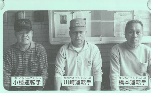
小椋運転手 川崎運転手 橋本運転手