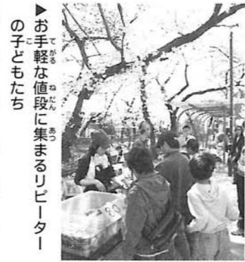
▶お手軽な値段に集まるリピーター の子どもたち