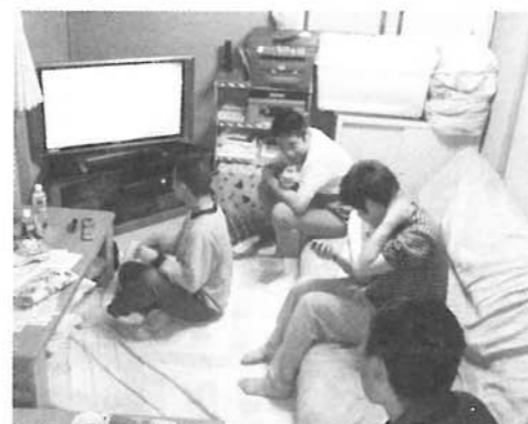
リビングでTVを見ている所です☆

今日ご紹介したものはほんの一部です。ケアホームの見学もいつでもお受けできますので、またお越しくださいませ。