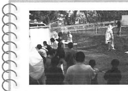
毎年恒例の大抽選会を行いましたあ〜!! 景品が当たった方や当たらなかった方からも「楽しかった!!」という声を頂き大盛況のまま今年の清流園祭も終了しました☆