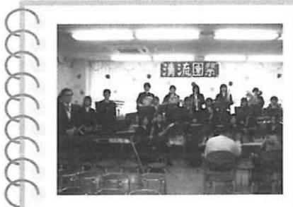
今回、初めて参加して頂いた尼崎北高校吹奏楽部の演奏やジャズバンド・歌謡ショー・人形劇・職員によるライブなど多種にわたるステージが繰り広げられ、楽しい一瞬を過ごしました☆ご参加頂いた皆様、本当にありがとうございました。