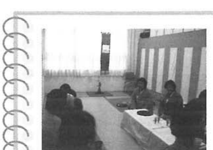
美味しい抹茶とお饅頭。利用者さんも共に上手にお手前が出来ました☆