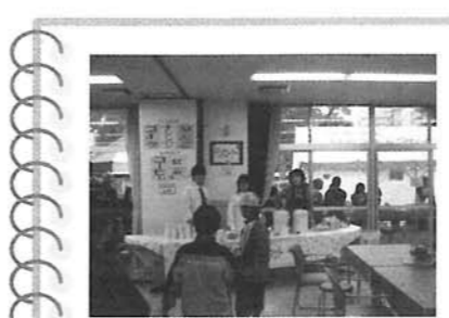
園祭で楽しんだ後に、ホットー息。暖かいコーヒーや冷たいドリンクで、のどの渇きを潤しました。お腹が空けば…食堂で美味しい食事を堪能しました。

今年もやってきましたあ〜清流園祭!! 今年も特集でその模様をお送りしたいと思います☆☆