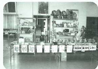
賞品をディスプレイし、自分でも好きな賞品を選んでいただきました。