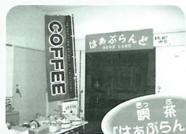
おいしいコーヒーやケーキで、ホット一息♪