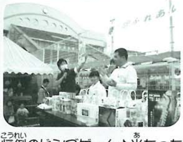
恒例のピンゲーム♪当たった人も、当たらなかった人も、大いに盛り上がりました！