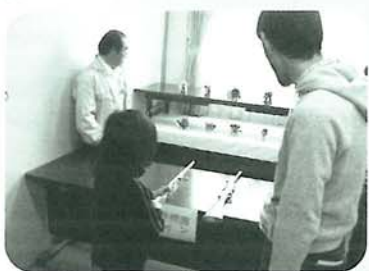
室内ゲームのボウリングや射的はみなさん興味津々で、何回も挑戦される方もいました。