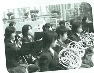
毎年恒例の稲園高等学校による吹奏楽演奏と大手前大学による和太鼓演奏に、みなさん聴き入っていました♪