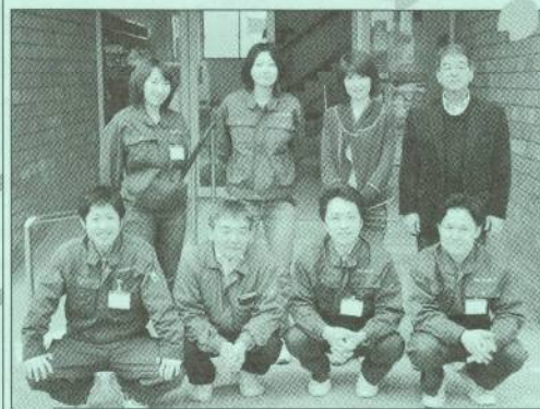
中原支援員 作田支援員 筒井支援員 富田支援員