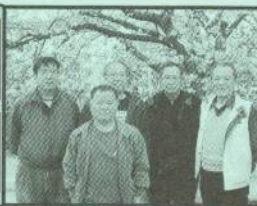
岡田 鶴田 八幡 浅井 藤本