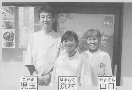
こだま 児玉 はまむら 浜村 やまぐち 山口