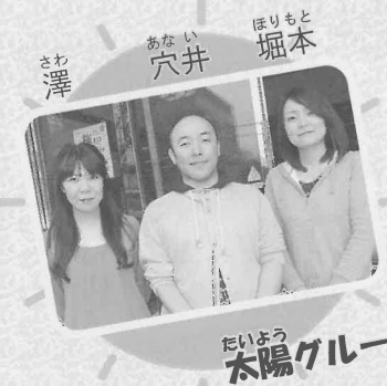
たいよう太陽グループ