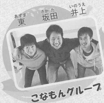
こなもんグループ