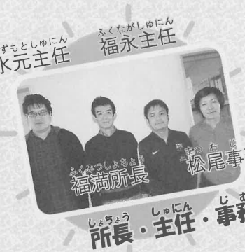
所長・主任・事務員