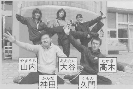
やまうち 山内 おおたに 大谷 たかぎ 高木 かんだ 神田 くもん 久門