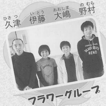
フラワーグループ