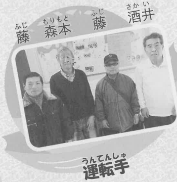
うんでんしりゅうてんてん運転手