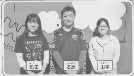
まつだ 松田 いしはら 石原 やまもと 山本