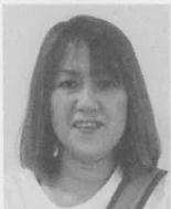
くい せ ふくせいえん 杭瀬福成園